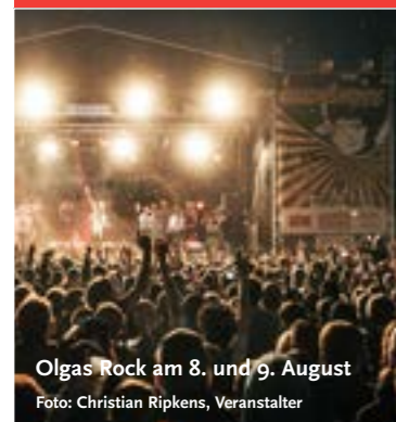
Olgas Rock am 8. und 9. August