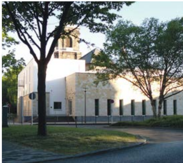
Ziel von Angriffen: Die Neue Synagoge in Wuppertal.

Neben zahlreichen Demonstrationen gegen den israelischen Militäreinsatz, auf denen teilweise Hamas-Fahnen geschwenkt und antijüdische Parolen gerufen wurden – nach einer Demonstration in Essen kam es sogar zu offenen Hitler-Verehrungen – sind auch die Synagogen nicht mehr sicher. In Essen wurden mehrere Menschen festgenommen. Sie stehen im Verdacht, einen Anschlag auf die Alte Synagoge Essen geplant