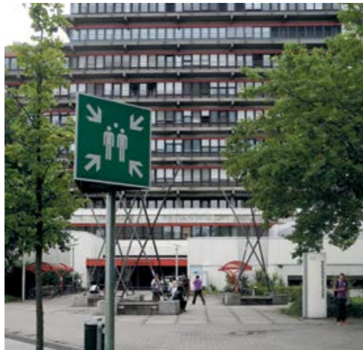
Der Kampf um die besten Köpfe tobt auch an der UDE

Als Basis für das DHV-Gütesiegel wurde ein detaillierter Fragebogen entwickelt. Gefragt wird etwa nach Fairness, Wertschätzung, Transparenz und Verlässlichkeit in Berufungs- und Bleibeverhandlungen. Diese Themen fließen zu 52 Prozent in das Gesamtergebnis ein. Die Ergebnisse aus Fragen zum Verfahren vor Ruferteilung werden mit