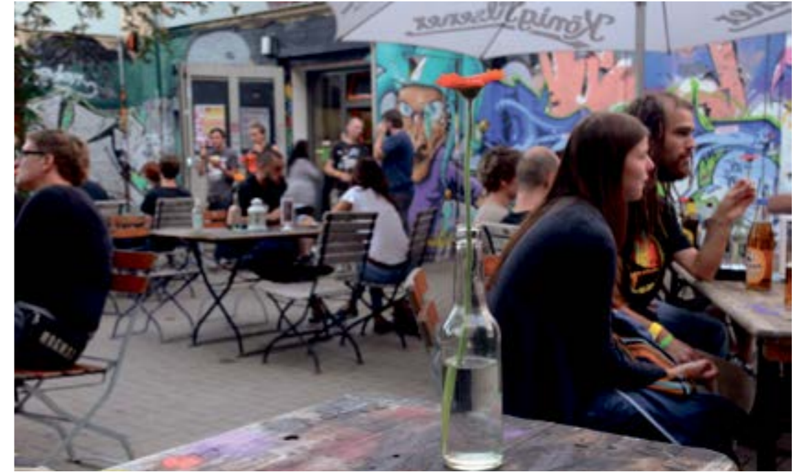
Die Ruhe nach dem Sturm und vor der Party: Entspannen in lockerer Atmosphäre vorm Druckluft (Foto: lenz)

Die Kieler/Hamburger Band Matula, welche verriet, dass sie das Jubiläum auch persönlich betreffe, da sie gerade auch alle die 35 überschritten haben, legte zum Schluss noch einen drauf. Es wurde punkiger, doch auch hier mischten sich Sentimentalität und Euphorie beim begeisterten Publikum. Um halb 12 waren die Kon-