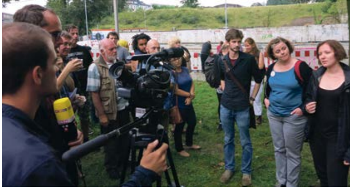
Presseaufgebot vor dem Thyssen-Krupp Gebäude an der Frohnhauserstraße

Die Polizei habe sich hingegen während der ganzen Zeit, die sie vor Ort war bis zur Räumung nicht geäußert, sogar einen Platzverweis habe sie laut Augenzeugen nicht ausgesprochen. Thyssen war ebenfalls an keinem Dialog interessiert und will sich