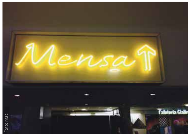
Der Pfeil nach oben zeigt es an: Der Preis für Schnitzel und Co. steigt.

Ob Tofu, Truthahn oder Tiramisu – Das Studentenwerk wird die Preise in den Mensen und Cafeterien für das nächste Semester deftig erhöhen. Ein Hauptgericht in der Mensa kostet dann 10 bis 20 Cent, Beilagen satte 10 bis 15 Cent mehr. Nach Dortmund und Bochum, wo das Essen in Mensen und Cafeterien schon zum 1. September teurer wurde, müssen Studierende der UDE ab dem 1. Oktober bei der Verpflegung tiefer in die Tasche greifen. Studierendenvertreter*innen warnen vor einer zunehmenden Verteuerung des Studiums.