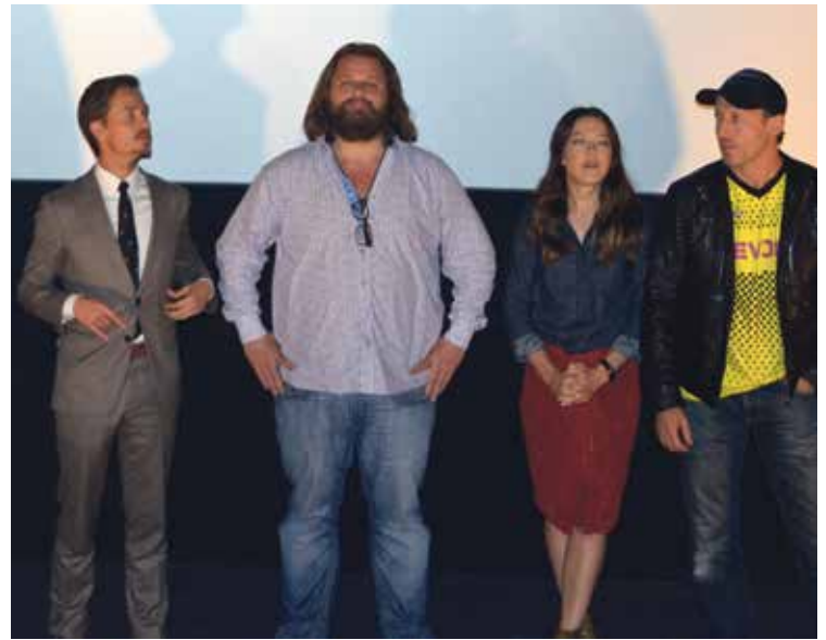
Das Cast (v.l.n.r): Tom Schilling, Antoine Monot Jr., Hannah Herzsprung und Wotan Wilke Möhring im UCI in Bochum.

meist gesuchtesten Hackern der Welt. Aus ihren kleineren Hackangriffen wird schlagartig blutige Realität. Denn schon bald verschwimmen die Grenzen zwischen Online- und Offlinekriminalität.