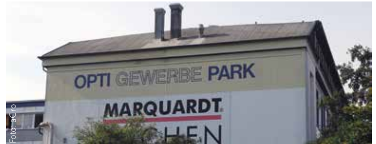
Im Essener Opti-Gewerbepark sollen Wachleute Flüchtlinge misshandelt haben. Die Flüchtlingsunterkunft wird von European Homecare betreut.