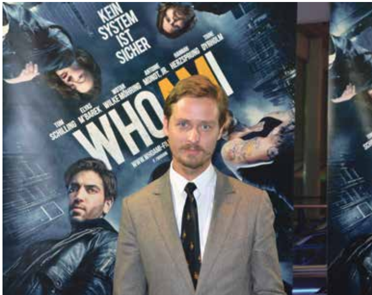
Im Film kaum wiederzuerkennen: Tom Schilling spielt den Hacker Benjamin Engel sehr überzeugend.