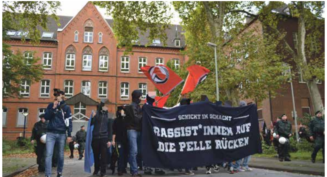
Vor dem St. Barbara-Hospital: Die Initiative gegen Duisburger Zustände demonstrierte am 27. September gegen die rassistische Stimmungsmache im Duisburger Stadtteil Neumühl.

Die Stimmung erhitze sich in den vergangenen Wochen weiter: Auf Facebook wurde ein Foto von zwei Frauen mit rumänischen Pass, die fälschlicherweise der Kindesentführung beschuldigt wurden, zigtausende Male verbreitet und gefordert, das Krankenhaus abzubrennen oder doch gleich sämtliche Roma nach Auschwitz zu schicken. Nach weiteren rassistischen Parolen rechter Parteien und nicht