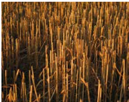
Sind leere Felder bald Realität?

Ein Mensch besteht u.a. aus etwa 700 Gramm Phosphor: es findet sich in unseren Knochen, im Gewebe, im Blut, in unserer DNS wieder. Kein Lebewesen kann ohne es auskommen. 80 Prozent des geförderten Phosphors dienen als Kunstdüngemittel, das vorwiegend in der konventionellen Landwirtschaft eingesetzt wird. Der Rohstoff wird aus Mineralien wie Apatit gewonnen. Da das abgebaute Phosphor zunehmend an Qualität verliert, könnte das Düngemittel schon in gut 20 Jahren knapp werden. Der Preis und die Nachfra-