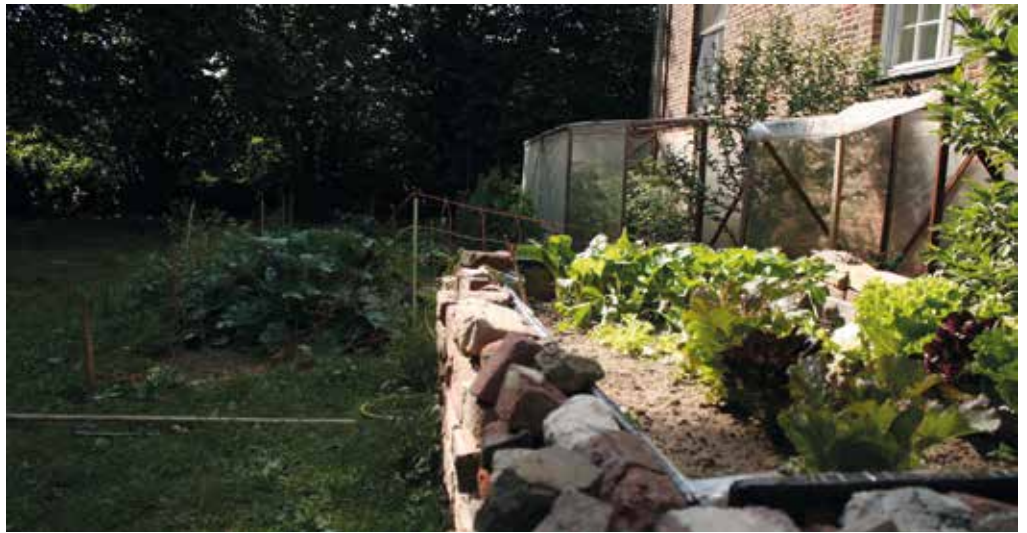
Eigene Gemüse im Garten anbauen: zukunftsweisend, lecker und macht Spaß.

ge nach Phosphor steigen, denn es spielt auch in anderen Bereichen wie der Herstellung von Batterien für Elektroautos eine Rolle. Bedrohlich kann in Hinblick auf die Zukunft auch der Fakt wirken, dass sich derzeit China, USA, Marokko, Russland und Tunesien drei Viertel der Phosphatförderung teilen. Der Rest der Welt ist vom bisher wenig erforschten Phosphor-Recycling des Abwassers und zum großen Teil von Importen abhängig.