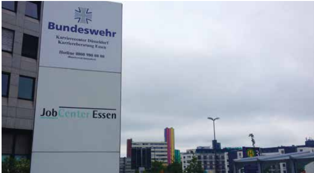
Nur einen Katzensprung entfernt: Beim Essener Arbeitsamt können sich Studierende auch hinsichtlich einer Karriere bei der Bundeswehr beraten lassen. (Foto: mac)

Die Bundeswehr beeinflusst: An vielen Universitäten machen die Streitkräfte für sich Werbung oder forschen an eigentlich zivilen Institutionen. Auch an der UDE gibt es eine Kooperation mit einem großen internationalen Rüstungsunternehmen und die Bundeswehr wird in Person eines Jugendoffiziers in ein Seminar der Politikwissenschaft eingeladen. Im zweiten Teil unserer Reihe „Fragwürdige Einflussnahmen auf die UDE“ haben wir zu diesen Verbindungen recherchiert.