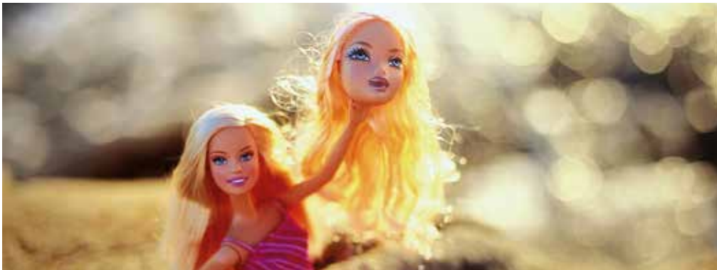
Die Jagd nach Köpfen wird verschärft. Geld gibts für alle Absolvent*innen.

Jede*r vierte Studierende hängt das Studium an den Nagel. In technischen und naturwissenschaftlichen Fächern schaffen es sogar 42 Prozent nicht bis zum Abschluss. Den Ergebnissen der Untersuchung des Deutschen Zentrums für Hochschul- und Wissenschaftsforschung (DZHW) möchte das Land Nordrhein-Westfalen nun entgegenwirken. Erhalten die Hochschulen demnächst einen Geldregen?