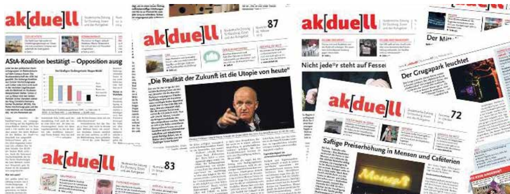
Kreative aufgepasst: Wir suchen neue Redakteur*innen!