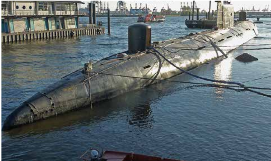
U-Boote an der UDE? Die Universität Duisburg-Essen unterhält eine Kooperation mit dem Rüstungsunternehmen Thyssen Krupp Marine Systems.