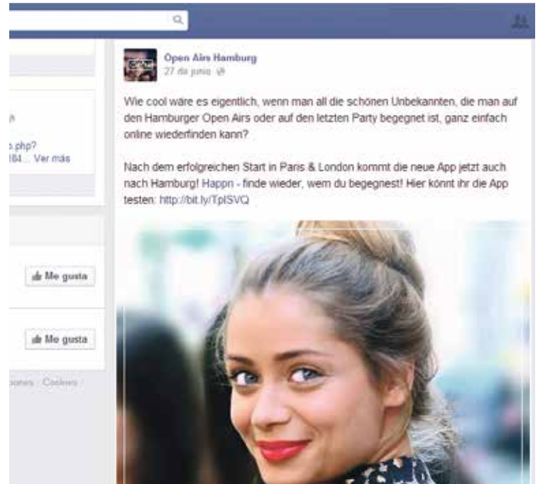
Die Facebook-Präsenz von „Open Airs Hamburg“ wirbt schon mit: Die App „happn“ soll die Kontaktaufnahme revolutionieren.

Ebenfalls interessant ist, dass Frauen die App kostenlos nutzen