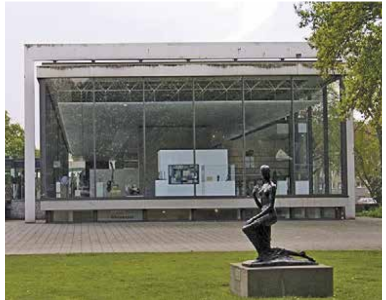
An und in das Lehmbruck-Museum in Duisburg sollten enge Röhren gebaut werden.

Für die Installation hat die Absage jetzt weitreichende Kon-