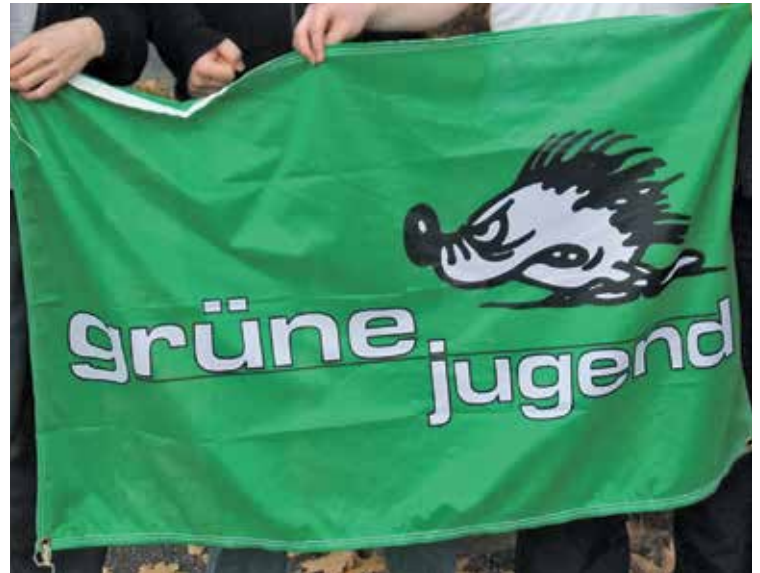
Das Thema Geschlecht und Gender beschäftigt derzeit die Grüne Jugend.

wird häufig eine geheime Umerziehungsmaßnahme vermutet.