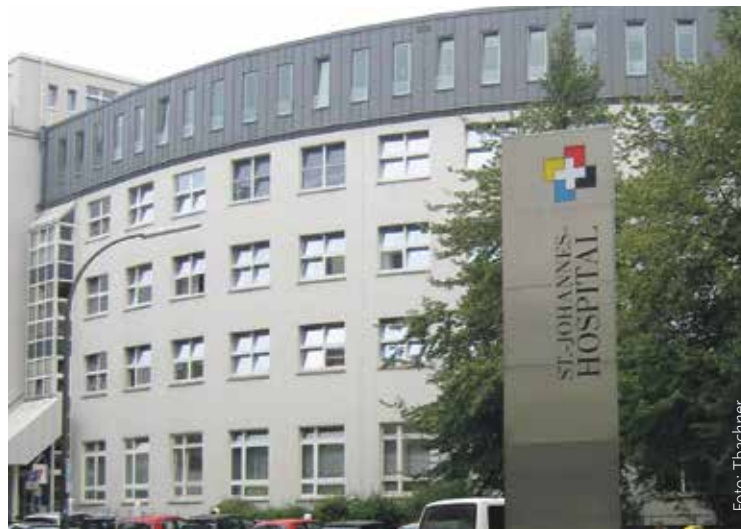
Nicht erwünscht: Kopftuchträgerinnen dürfen hier nicht arbeiten.

Kopftuchverbote in Krankenhäusern mit christlicher Trägerschaft sind keine Seltenheit. Die Gewerkschaften sehen die Regelung kritisch. „Ich sehe keinen Grund, dass die Frau ihre Arbeit mit Kopftuch nicht vernünftig machen kann“, sagt Verdi-Spre-