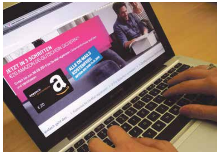
„E-Mail made in Germany“ – mit diesem Slogan und mit einem Einkaufsgutschein als Prämie will Telekom De-Mail-Verträge unter die Leute bringen. Wer dem auf den Leim geht, hat einige Nachteile.

Tatsächlich geben De-Mail-Nutzer*innen viel mehr über sich preis, als ihnen häufig bewusst ist. Rund 250 bei der Bundesnetzagentur registrierte Behörden können Name und Anschrift der Betroffenen einfach per Online-Formular abfragen. Darüber hinaus ist im Telekommunikationsgesetz geregelt, dass die hinterlegten persönlichen Daten für eine Vielzahl von Sicherheitsbehörden und Geheimdienste noch viel weitergehender zugänglich sind: De-Mail-Anbieter wie